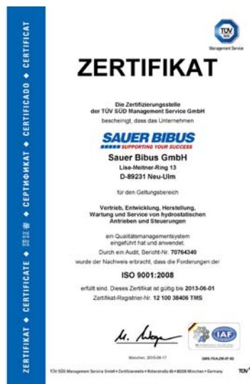
Bild 3 - Zertifizierungsurkunde SAUER BIBUS ist nach DIN ISO 9001 zertifiziert.

Bildmaterial zu dieser Presseinformation kann unter www.yource.de , im Anhang des dort veröffentlichten Textes, herunter geladen werden.