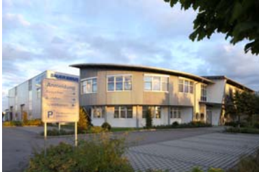
Bild 2 - Außenansicht In der Lise-Meitner-Straße in Neu-Ulm ist das innovative Unternehmen SAUER BIBUS zu Hause.